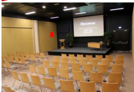
Salle de conférence