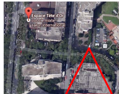
Parking privé 33 rue Louis Guérin