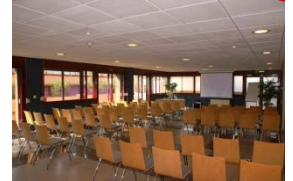
6 Salles tables rondes et workshop